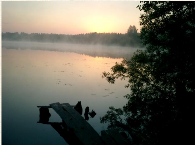
фото и комментарии Владиславы Валуйской, 13 лет

Эти хилые мостки на берегу озера находятся около «дикого» пляжа. С виду сами мостки ничем не примечательны, только красивый закат и туман поднимается над озером. А вот пляж этот называется «Ведьминым». Думаю, назвали его так просто из-за того, что тут часто рано утром и поздно вечером, когда никого нет, купаются обнаженные девушки. А какая возникает ассоциация среди почти сказочного леса и озера с русалками, когда эти женщины при свете луны вылезают из воды? Ну, конечно, ведьмы... Несмотря на такое объяснение, пляжик действительно симпатичный. И красиво там. По вечерам.