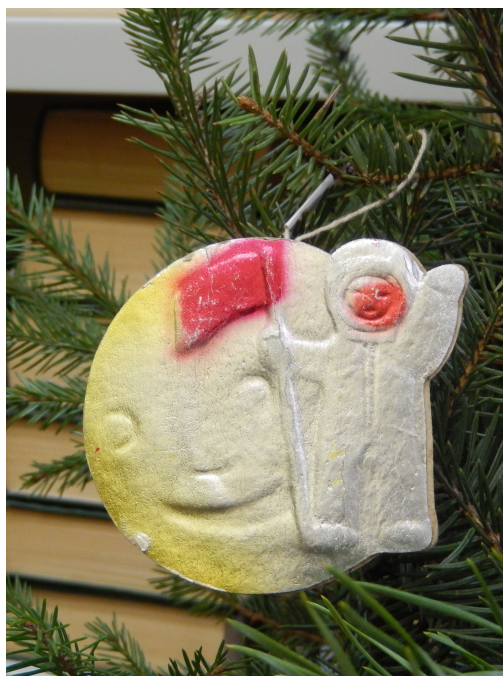
Космонавт на Луне. Краска «под серебро» 7,2*8,0 см.