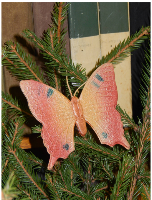
Бабочка. Картон, конгрев, вырубка, склейка 10,0*8,5 см.