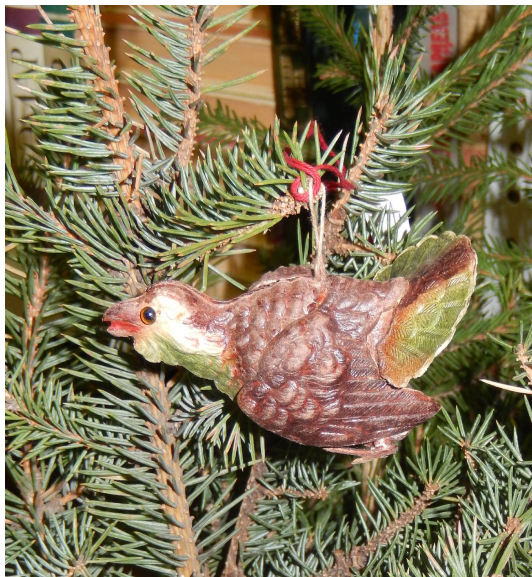
Тетерев токующий. 5,5*7,5*3,5 см. Бумага, цветное стекло. Печать – хромолитография, вырубка, монтаж из 9 отдельных элементов