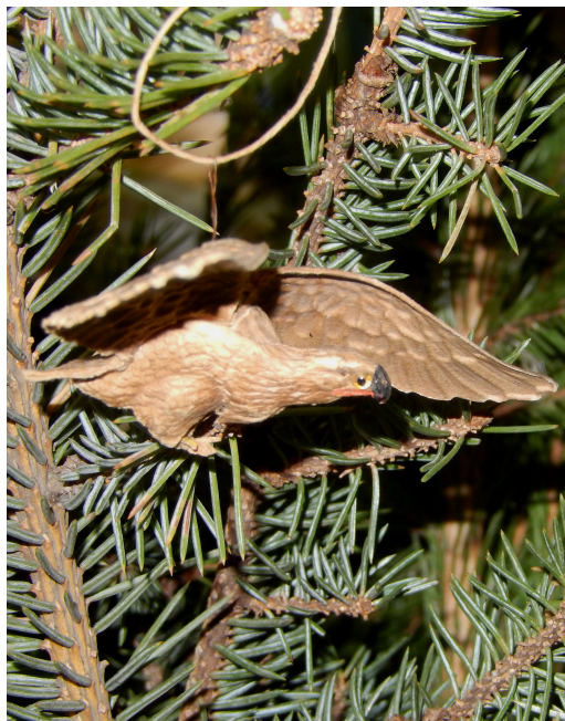
Орел в полете. 9,0*7,0*2,0 см. Бумага, цветное стекло. Печать – хромолитография, вырубка, монтаж из 7 элементов