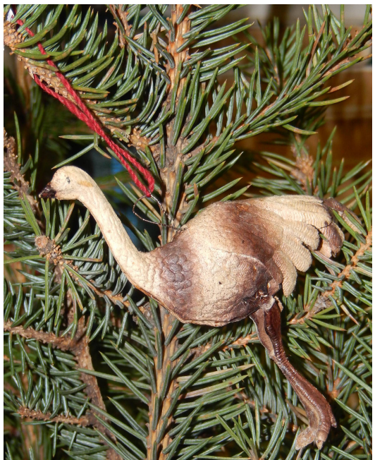
Страус. 8,0*9,0*2,0 см. Бумага, цветное стекло. Печать – хромолитография, вырубка, монтаж из 5 элементов