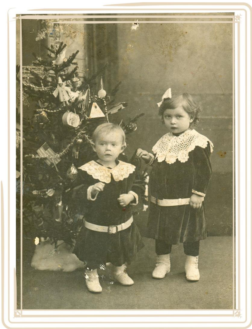
Дети у рождественской елки. Начало XX века.