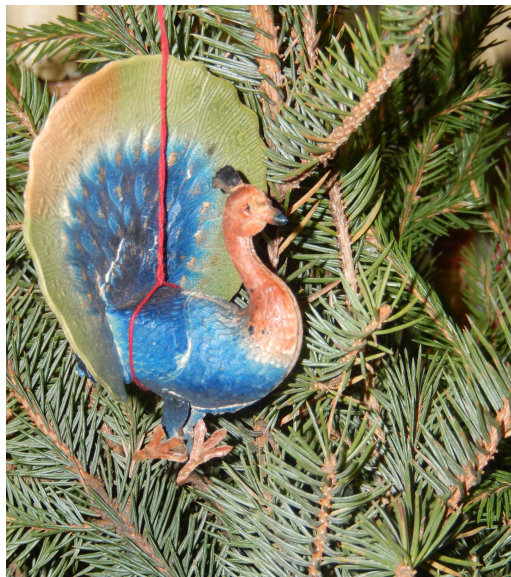
Павлин. 8,0*7,0*6,5 см. Бумага, цветное стекло. Печать – хромолитография, вырубка, монтаж из 8 элементов

Украшения сложные, полнообъемные, многоэлементные