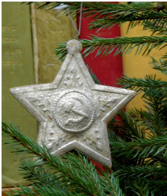
Звезда с серпом и молотом. Краска «под серебро» 8,8*8,0 см.