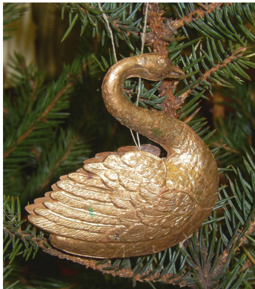
Лебедь плывущий. 7,0*6,5*1,5 см. Краска «под золото». Состоит из 4 элементов

Украшения полубъемные, менее сложные, с уменьшением числа элементов