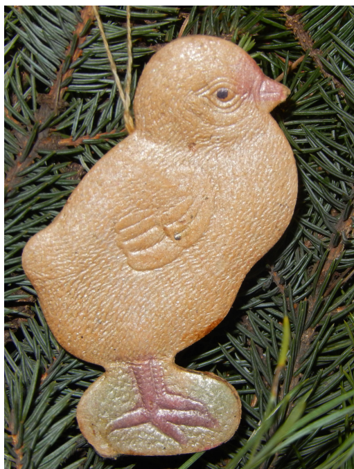
Цыпленок. Картон, конгрев, вырубка, склейка 11,5*6,0 см.