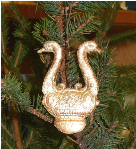
Лира. 7,5*5,2*0,3 см. Краска «под золото». Состоит из 2 элементов