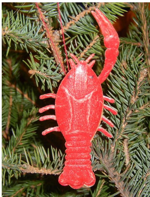
Рак. 11,5*6,0*0,8 см. Состоит из 3 элементов