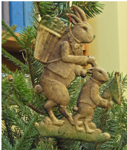
Зяц с корзиной подарков и зайчонок с елкой. Картон, конгрев, вырубка, склейка 12,0*7,5 см.

Украшения почти плоские, низкорельефные. Состоят из двух частей. Стали эталонами для СССР