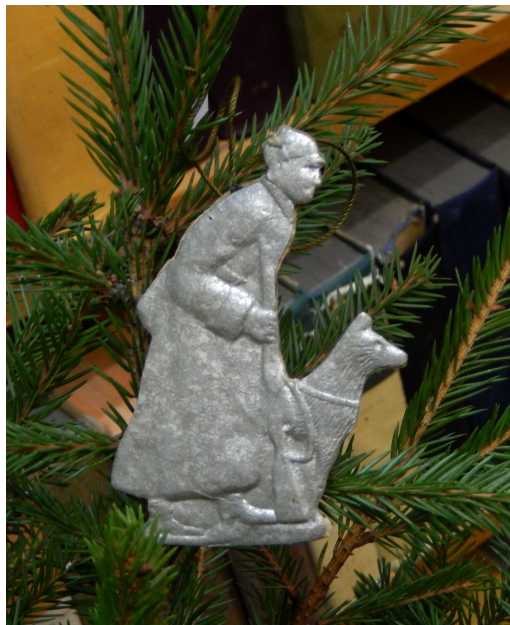
Пограничник с собакой (Пограничник Карацупа с псом Индусом). Краска «под серебро» 9,0*7,0 см.