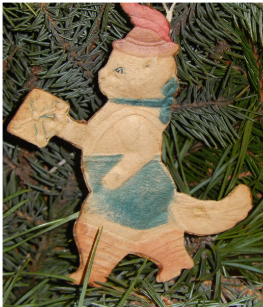
Кот в сапогах с письмом. Картон, конгрев, вырубка, склейка 12,0*8,0 см.