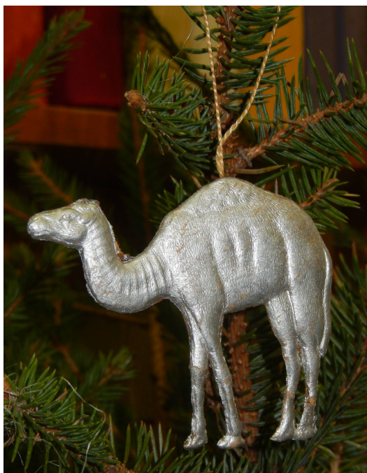
Верблюд. Краска «под серебро» 6,5*7,5 см.