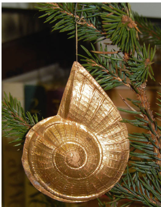
Раковина. 8,0*5,6*1,6 см. Краска «под золото» Состоит из 2 элементов