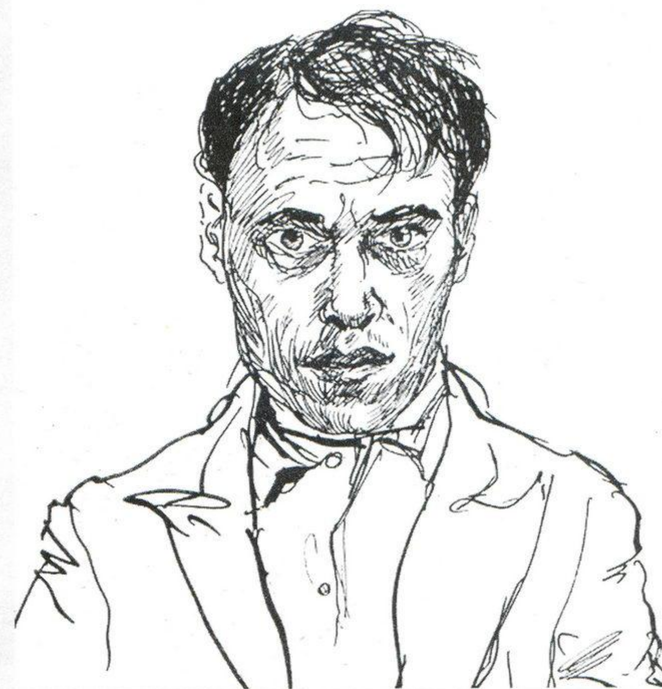
Автопортрет. 1939 г. Бумага, тушь, перо. 14x17

Произведения Б.С. Кротикова хранятся в музеях Н.Новгорода, Москвы, Владимира, Омска, Городца и многих частных коллекциях.