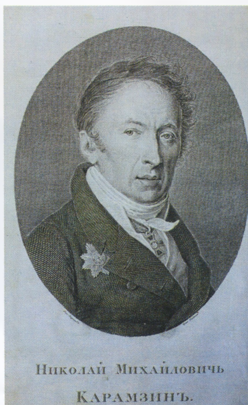
Николай Михайлович КАРАМЗИНЪ.