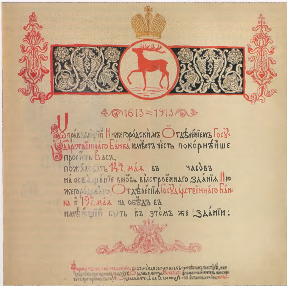
Образец приглашения на освящение нового здания Нижегородского отделения Государственного банка от имени его управляющего. 1913 г. ГКУ ЦАНО. Ф. 403. Оп. 674. Д. 787. Л. 32.

но ранен народовольцем Игнатием Гриневицким 1 марта 1881 года в Петербурге. В память мученической кончины императора в 1882-м в Нижнем Новгороде была построена Царская часовня рядом с храмом Рождества Иоанна Предтечи. Она посвящена небесному покровителю императора — святому благоверному князю Александру Невскому 14 .